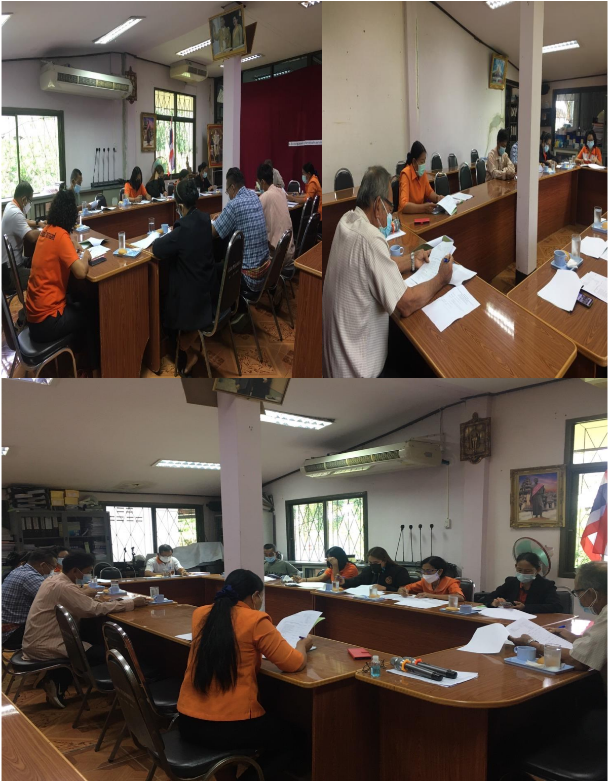
รูปภาพ ประชุมคณะกรรมการติดตามประเมินผลแผนพัฒนา พ.ศ. ๒๕๖๑-๒๕๖๕ ประจำปี ๒๕๖๕ วันที่ ๗ เมษายน พ.ศ. ๒๕๖๕ ณ ห้องประชุมองค์การบริหารส่วนตำบลท่าลาดขาว