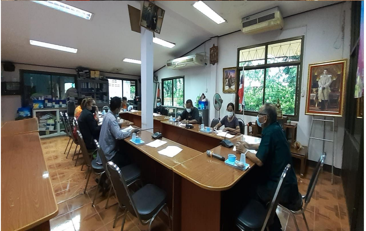
รูปภาพ ประชุมคณะกรรมการติดตามประเมินผลแผนพัฒนา พ.ศ. ๒๕๖๑-๒๕๖๕ ประจำปี ๒๕๖๕ วันที่ ๖ ตุลาคม พ.ศ.๒๕๖๕ ณ ห้องประชุมองค์การบริหารส่วนตำบลท่าลาดขาว