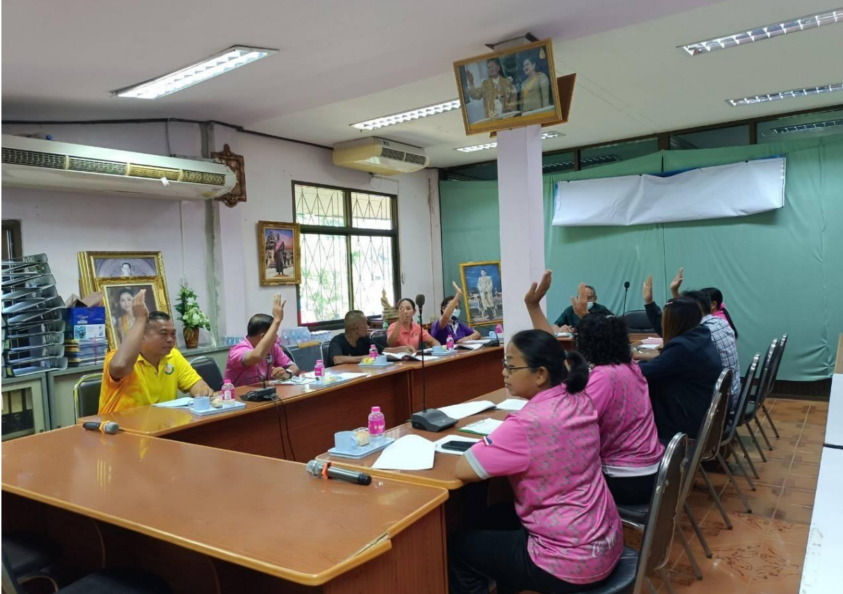
รูปภาพ ประชุมคณะกรรมการติดตามประเมินผลแผนพัฒนา พ.ศ. ๒๕๖๑-๒๕๖๕ ประจำปี ๒๕๖๖ วันที่ ๑๗ ตุลาคม พ.ศ. ๒๕๖๖ ณ ห้องประชุมองค์การบริหารส่วนตำบลท่าลาดขาว